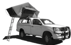
Toyota Hilux Single Cab