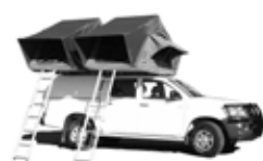
Toyota Hilux Double Cab