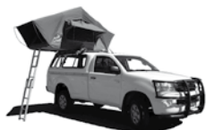
Toyota Hilux Single Cab