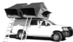
Toyota Hilux Double Cab